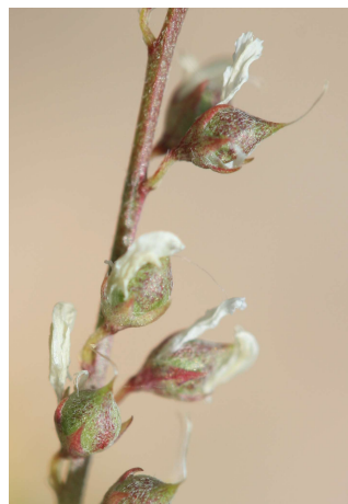
Trigonella wojciechowskii (Fressac - 30)