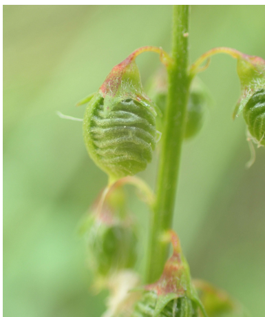
Trigonella elegans (Agonès - 34)

Plantago lanceolata L. Polygala vulgaris L. Potentilla verna L. (= P. tabernaemontani Asch.) Quercus coccifera L. Quercus ilex L. Quercus pubescens Willd. Rapistrum rugosum subsp. rugosum (L.) All. Rhaponticum coniferum (L.) Greuter (= Leuzea conifera (L.) DC.) Rosmarinus officinalis L. Rostraria cristata (L.) Tzvelev Rubia peregrina subsp. peregrina L. Rubus ulmifolius Schott Rumex crispus L. Salvia pratensis L. Salvia verbenaca subsp. verbenaca L. Scabiosa atropurpurea var. maritima (L.) Fiori Schoenus nigricans L. Scorpiurus subvillosus L. (= S. muricatus subsp. subvillosus (L.) Thell.) Scorzonera hispanica subsp. asphodeloides (Wallr.) Arcang. (= S. hispanica subsp. glastifolia (Willd.) Arcang.) Sherardia arvensis L. Staelina dubia L. Stipa offneri Breistr. Teucrium polium subsp. clapae S. Puech Thymus vulgaris L. Trifolium campestre Schreb. Tyrimnus leucographus (L.) Cass. Urospermum dalechampii (L.) Scop. ex F.W. Schmidt Urospermum picroides (L.) Scop. ex F.W. Schmidt Viburnum tinus L. Vincetoxicum hirsundinaria Medik. Vincetoxicum nigrum (L.) Moench