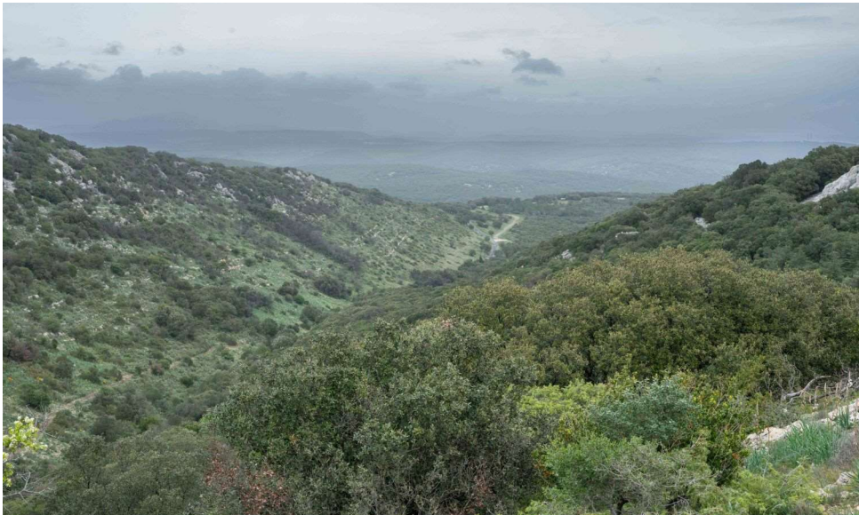
Vallon à l'est du Puech Cabre, au niveau des petites barres rocheuses [TR]