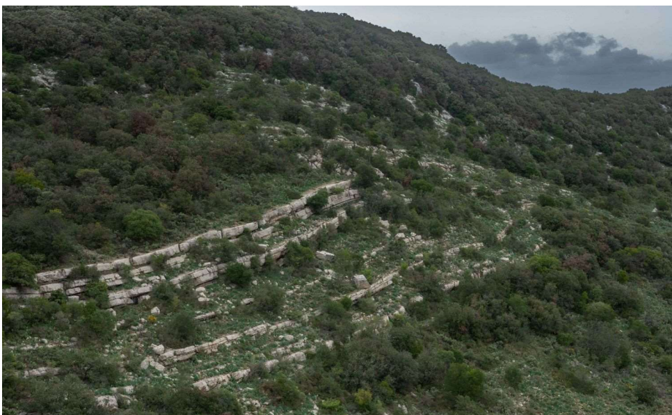
Les petites barres rocheuses à l'est du Puech Cabres [TR]