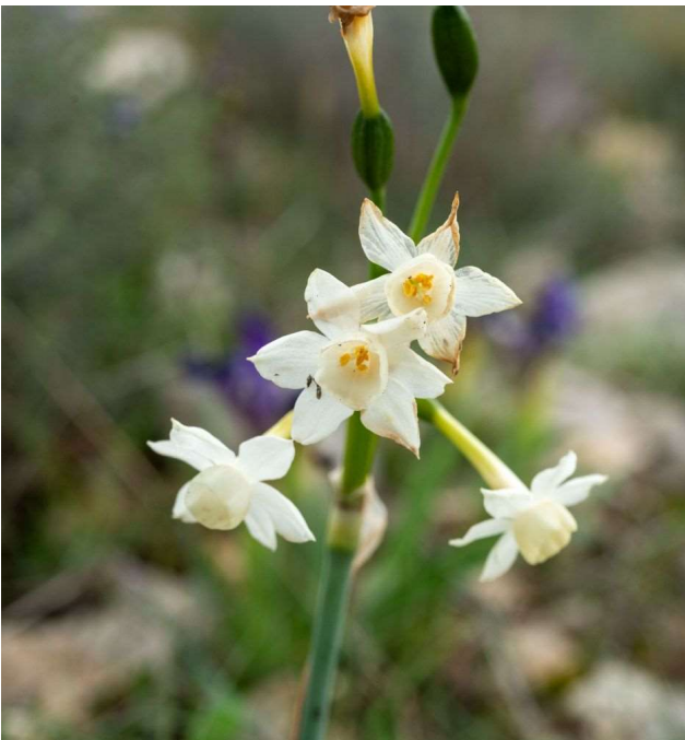
Narcissus dubius [TR]