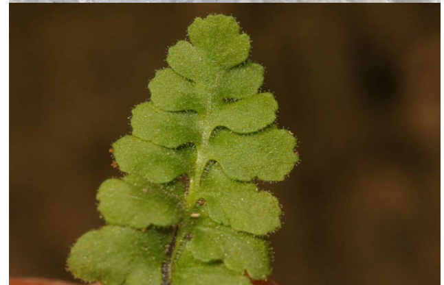
Asplenium petrarchae [FA]