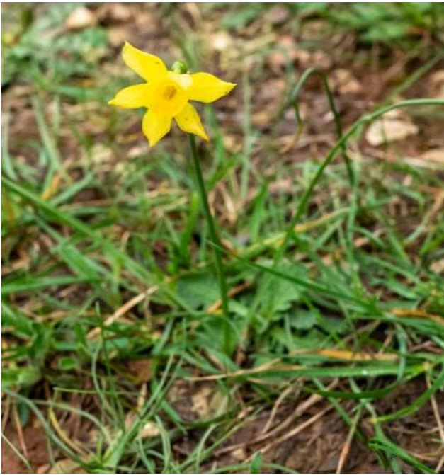
Narcissus assoanus [TR]