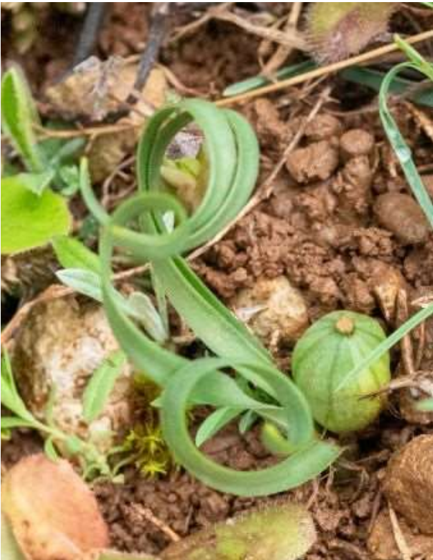
Sternbergia colchiciflora [TR]