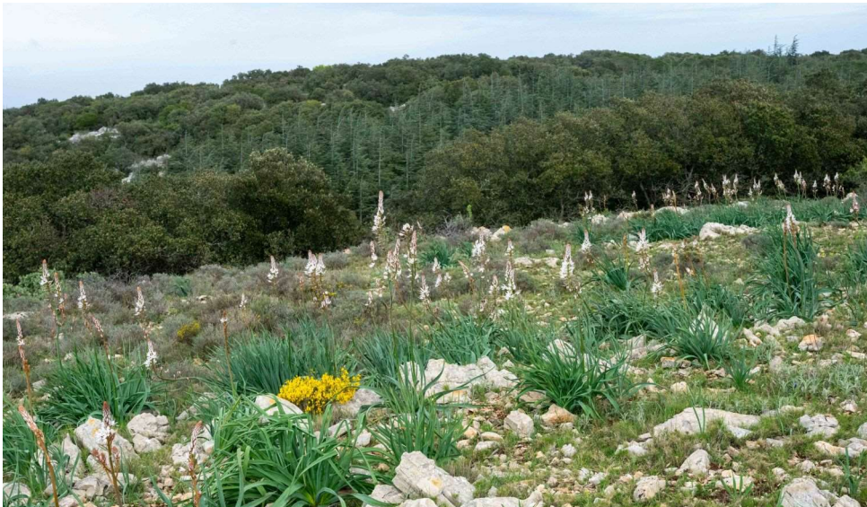
Garrigue fleurie entre Puech Cabre et la Baumette [TR]