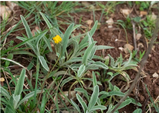
Phlomis lychnitis [TR]