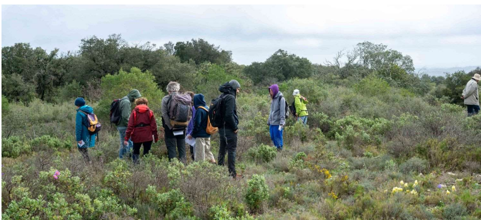
A la recherche des Sternbergia ... [TR]