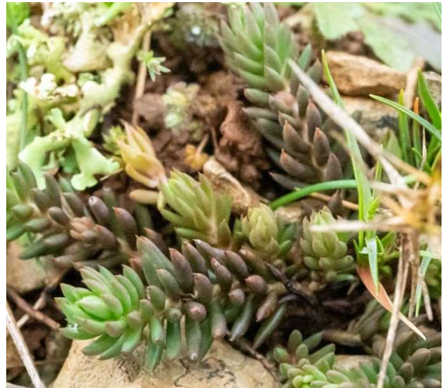
Petrosedum sediforme [TR]