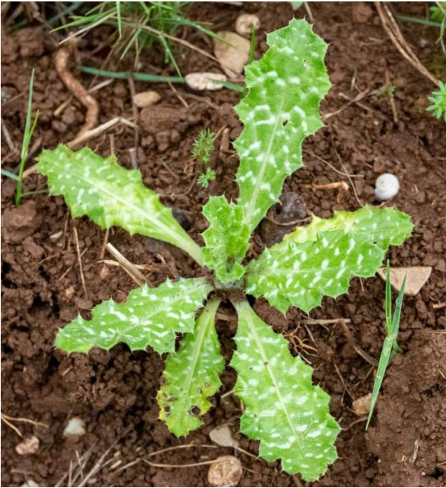
Tyrimnus leucographus [TR]