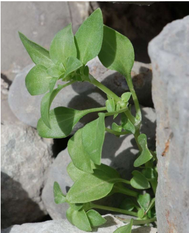
Theligonum cynocrambe [FA]