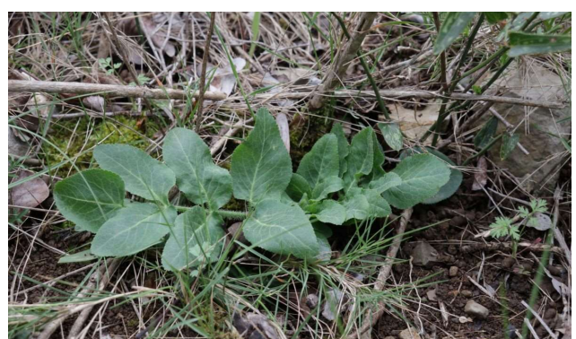
Opanax chironium [FA]