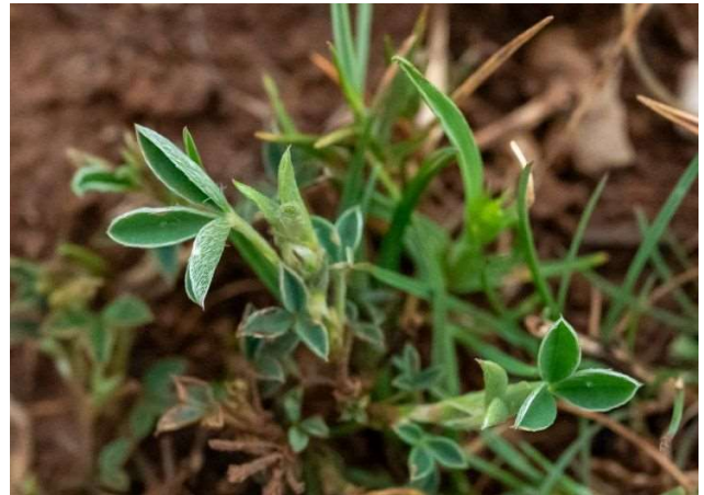
Argyrolobium zanonii [TR]