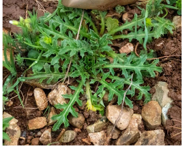
Carthamus lanatus [TR]