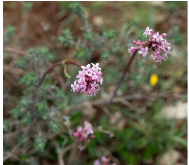
Valeriana tuberosa [TR]