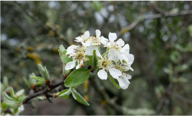
Pyrus spinosa [TR]