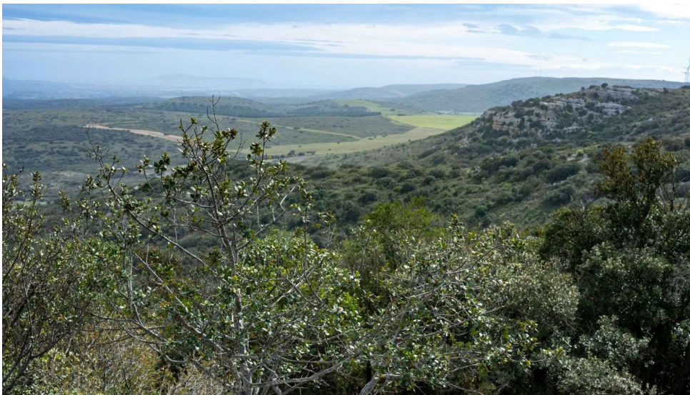
Bordure du Causse d'Aumelas au-dessus de la Baumette [TR]