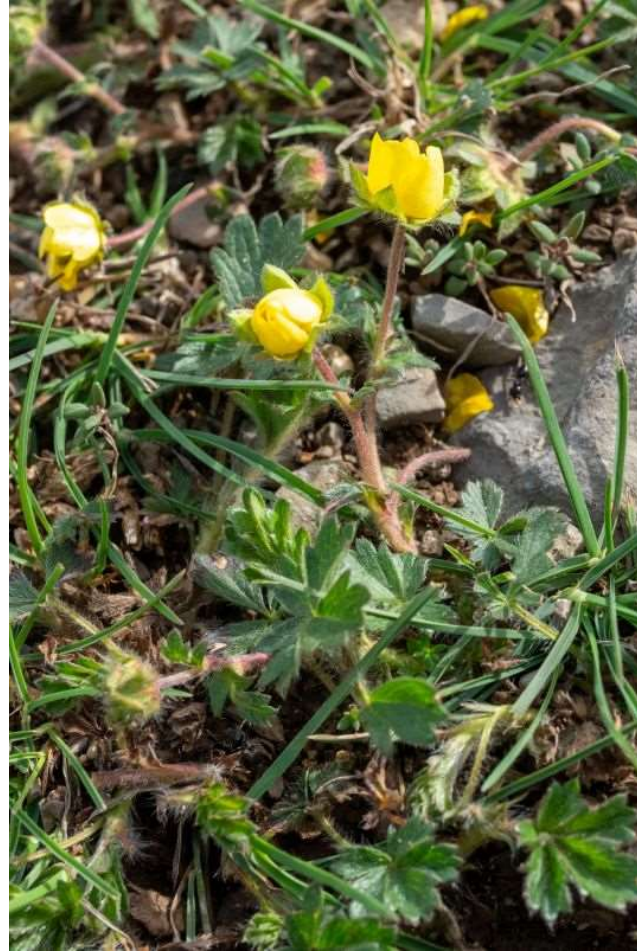
Potentilla verna [TR]