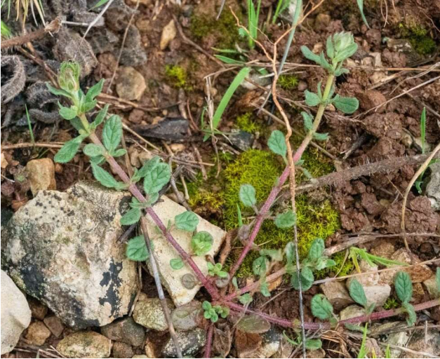
Helianthemum salicifolium [TR]