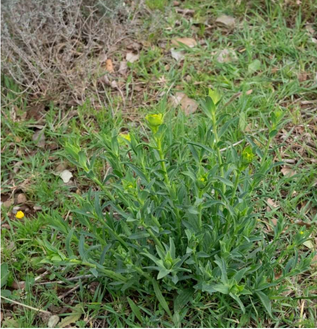
Euphorbia serrata [TR]