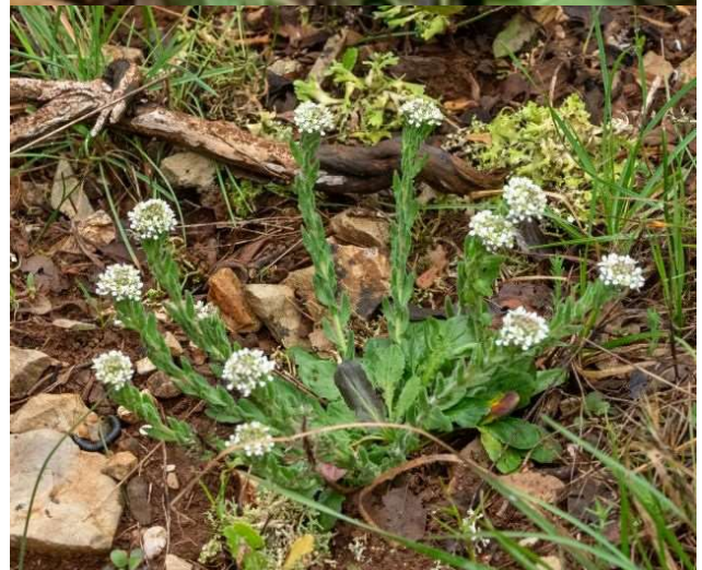
Lepidium hirtum [TR]