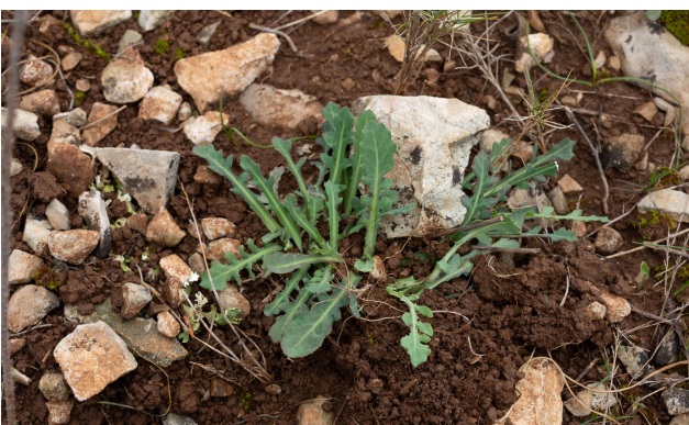
Reichardia picroides [TR]