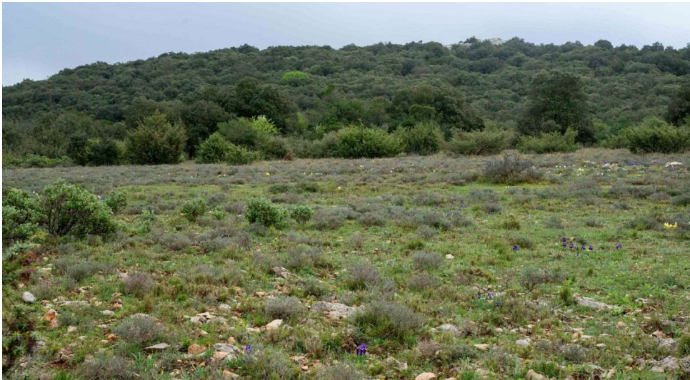
Pelouse à Sternbergia colchiciflora du Causse d'Aumelas [TR]