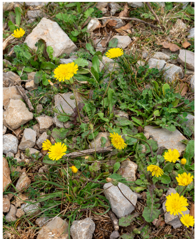
Crepis sancta [TR]