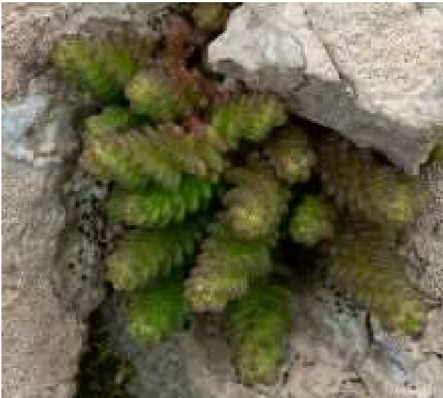
Sedum acre [TR]